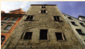
Geschlechterturm in Regensburg (Kastenmayrturm in der Wahlenstraße) und ...

120 Seiten, 142 Farbabbildungen, Geb. mit Schutzumschlag ISBN 978-3-7917-2237-5, € (D) 24,90