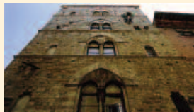
Geschlechtertum nahe der Piazza del Campo in Siena.

Der Band zeigt eindrucksvolle Bauwerke, die im Mittelalter in Regensburg entstanden sind, und setzt diese in Beziehung zu Bauten aus ganz Europa. So führt das Buch sowohl durch die wunderbare Altstadt von Regensburg als auch durch Deutschland, Italien, Spanien, Frankreich, England, Irland, Tschechien, Polen und Ungarn.